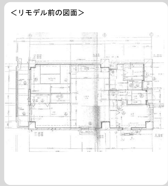
<リモデル前の図面>

リモデル前のお施主様のお悩み・ご要望 トイレの古さが気になります。もっとデザインの優れたトイレが欲しい。というタイミングで店会フェアで一目惚れです。あと、分電盤とかドアホン、窓まわりなど色々困っています。 ●お悩みの原因とお施主様に提案した解決方法 壁排水ですが、大丈夫です。お気に召されたものが一番です。コンセントを奥に移動してアース線を準備します。ペーパーホルダーも艶感のある陶器仕上げにします。その他もすべてご要望に叶うもので仕上げます。